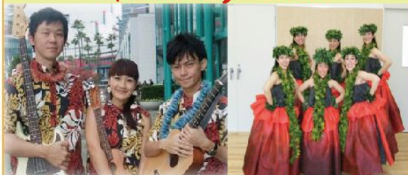
alohana quartette with Hui O Leimomi